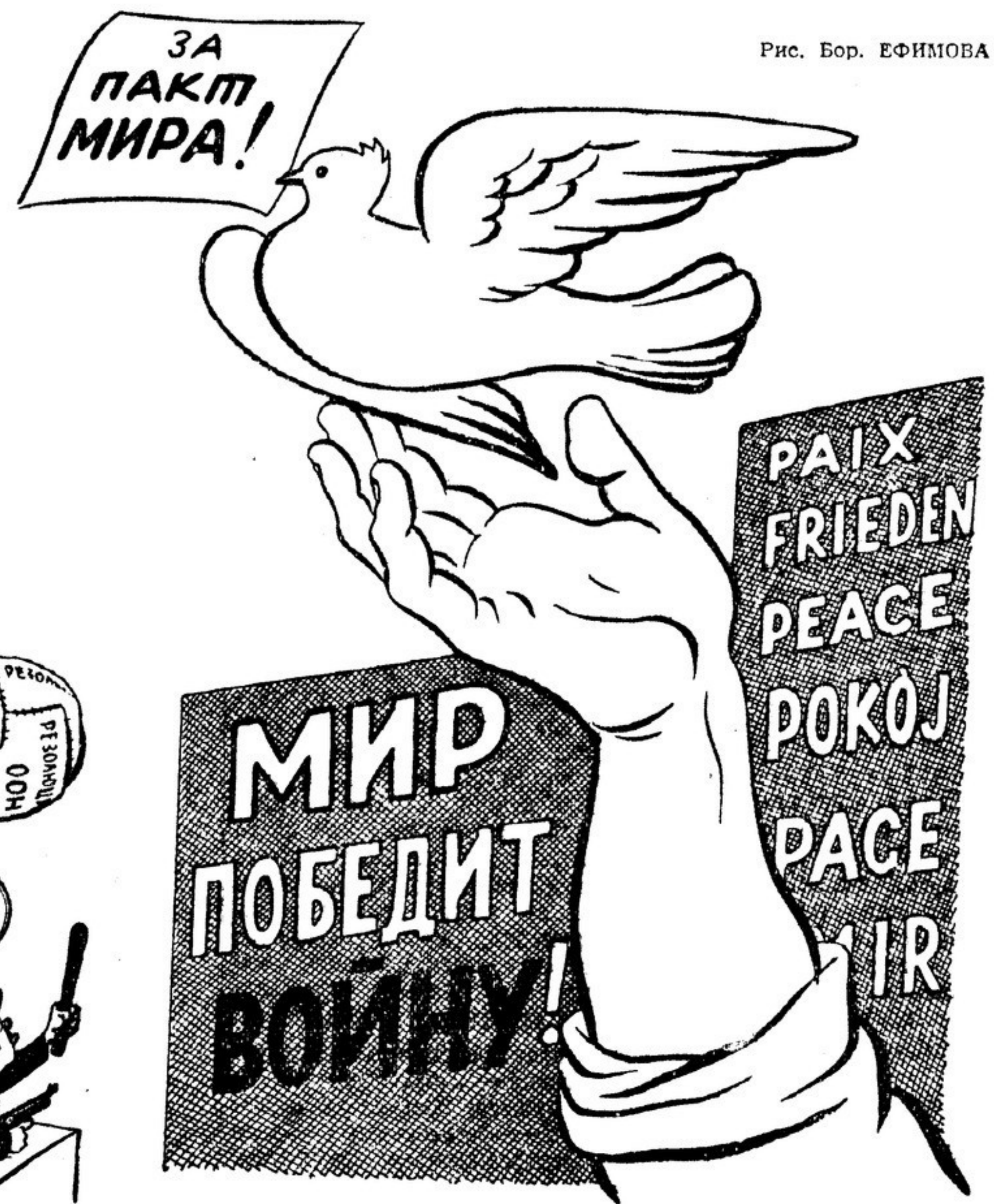
Рис. Бор. ЕФИМОВА

У него одно решение, Резолюция одна: — Мирю мир, войне война!